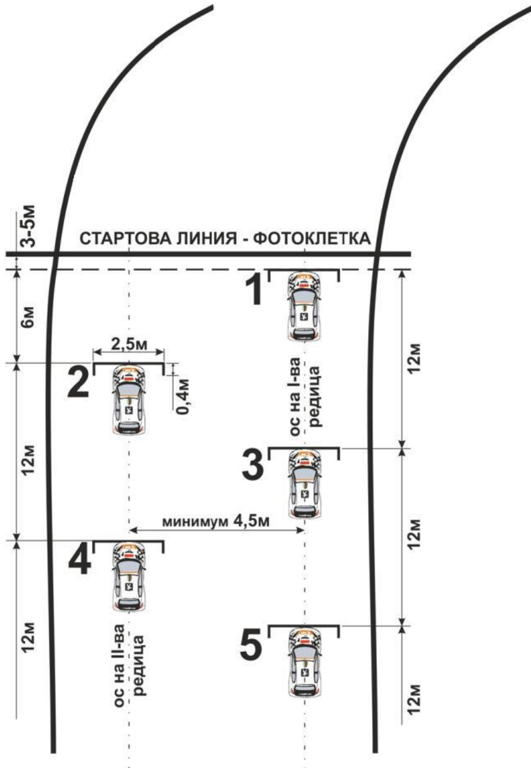
СХЕМА НА СТАРТОВА РЕШЕТКА